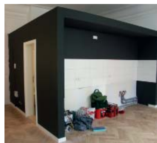
Um Bad und Küche in die Wohnung integrieren zu können, wurde eine schwarze Box in den 3,60 m hohen Raum integriert.