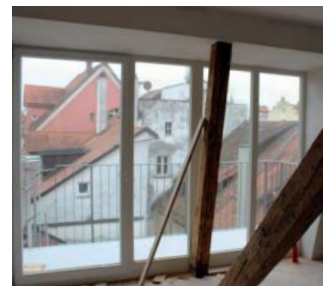
Highlight des neu entstandenen Ein-Zimmer-Appartements im DG ist der neue Balkon mit Sicht auf die Dächer der Insel.