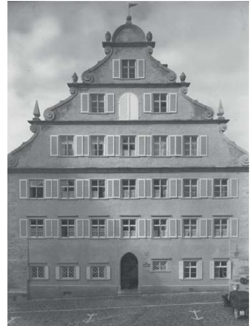
Mehrfach wurde die Fassade umgestaltet: 1855 ließ die Stadt den barocken Bau gothisieren, 1938 hat man das äußere Erscheinungsbild re-barockisiert.

BZ-Fotos: Bauarchiv Stadt Lindau/Architekt May