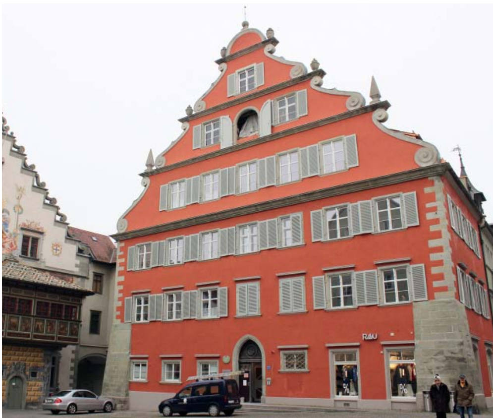
Das Neue Rathaus direkt neben dem Alten Rathaus auf der Insel Lindau beherbergt nach umfangreichen Baumaßnahmen zehn außergewöhnliche Wohnungen mit ganz eigenem Charme.

„Uns war es wichtig, auf der Insel bezahlbaren Wohnraum zu erhalten“, sagt Annette Wacker von der GWG. Der Zuspruch war groß. Alle Wohnungen sind vermietet. HG